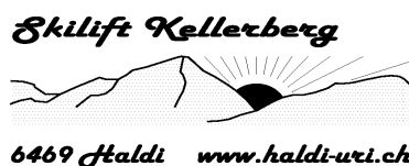
Skihaus SSC Schattdorf, Haldi